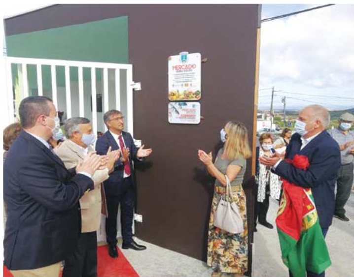
Momento da inauguração e visita ao mercado