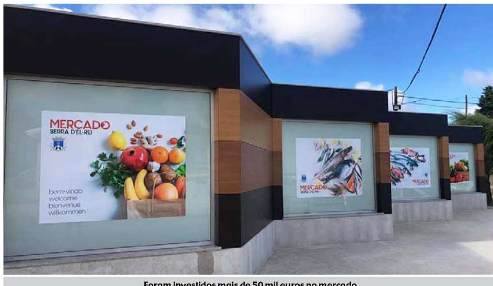
Foram investidos mais de 50 mil euros no mercado

O mercado estará aberto de terça a domingo, das 08h00 às 14h00.