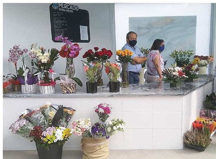
Frutas, legumes e flores